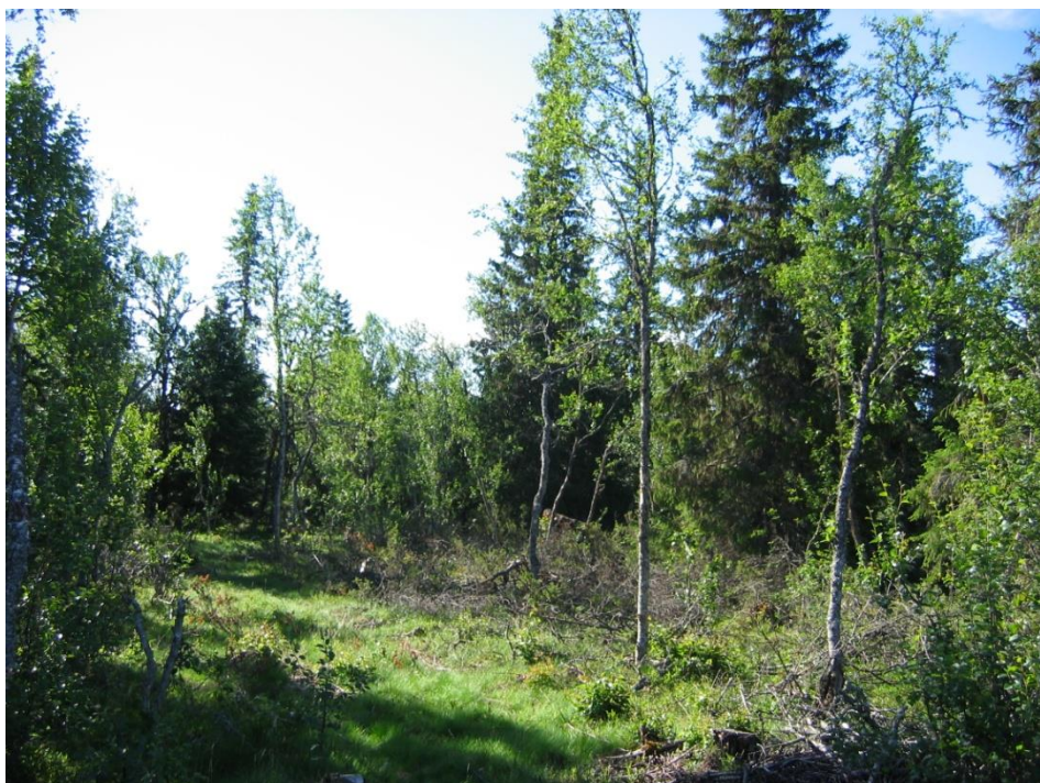
Skeive, granne stammer og liten krone gir dårlig stabilitet mot snø og vind. Her burde det vært satt igjen noen grøvre og bedre trær, mens de dårligste med fordel kunne vært hogd.