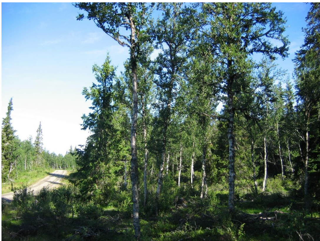
Fint tynnet bjørkebestand i Svarthaugen. Rette stammer og god, dyp krone gir stabilitet mot snøbrekk. Bjørka, som et lyselskende treslag, reagerer med økt tilvekst ved fristilling. Hogstformen vil av den grunn gi vedskog med større dimensjoner i framtida. I tillegg er dette et flott skogbilde som bidrar til å gi brukere av våre fjellområder en bedre opplevelse.