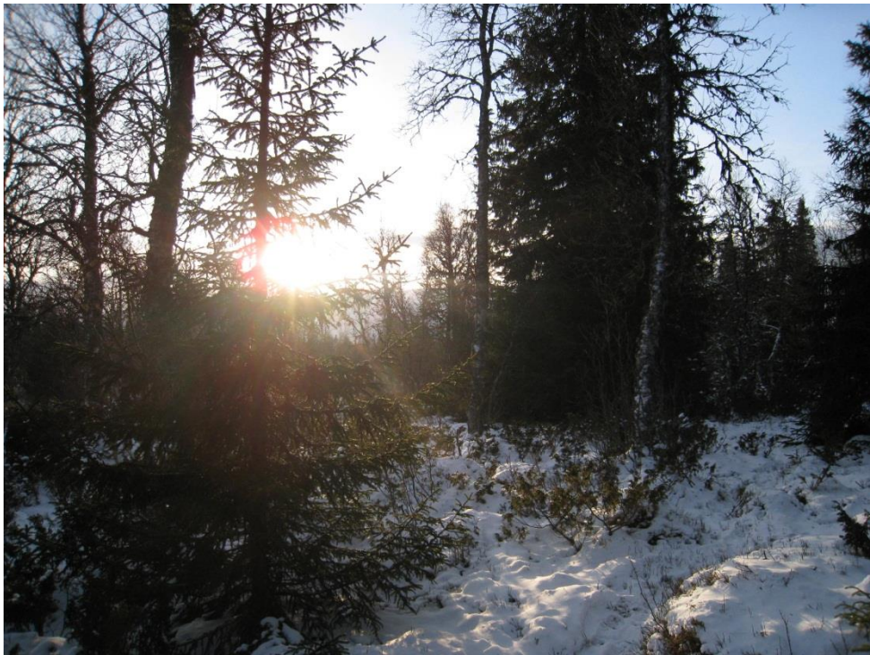
Blandingsskog av bjørk og gran utgjør et viktig leveområde for planter og dyr

Skog på seterløkker og dyrkingsparseller i almenningen kommer inn under almenningslovens bestemmelser om virkesrett, og hogst av denne skal utvises på samme måte som ordinær utvisning til sjøhoggere, enten det gjelder med eller uten bruksrett.